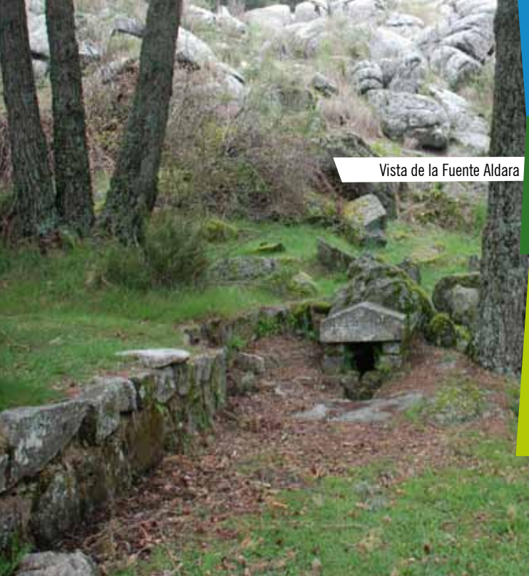
Vista de la Fuente Aldara